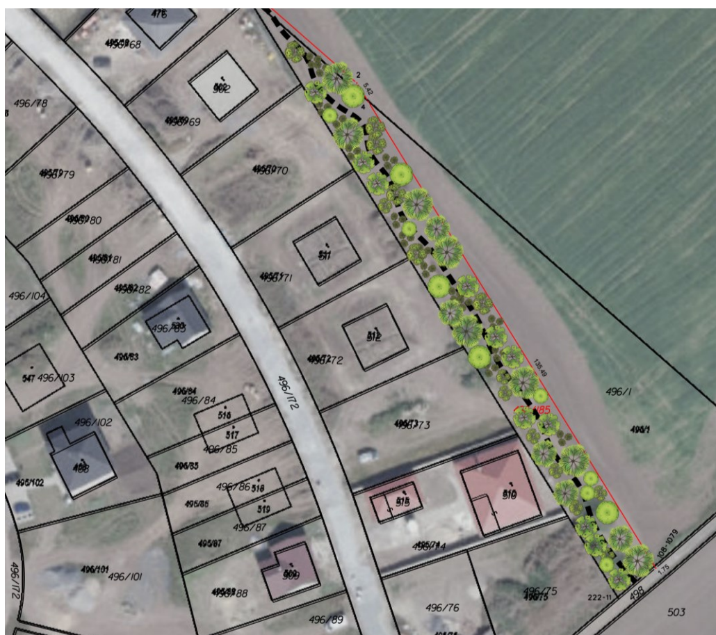
Obr. 2 – vizualizace přínosu realizace plochy změny v krajině K.1