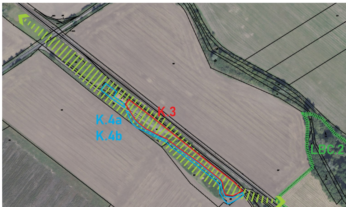
Obr. 3 – schéma krajinotvorné funkce ploch změn v krajině K.3, K.4a a K.4b

veřejnému prostranství také zkvalitnění prostupnosti krajiny a podmínek pro každodenní rekreaci.