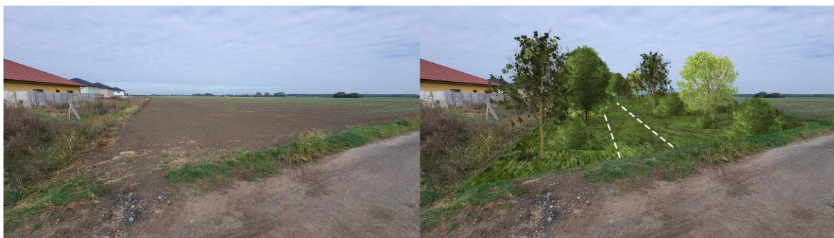
ostrý střet otevřené krajiny a zástavby